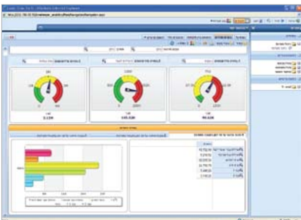
מערכת בינה עסקית - לוח מחוונים

היכולת להפיק ולשלוח התראות היא תכונה מרכזית במערכת התומכת בתהליכי עבודה. התראות יוצרות מודעות לנושאים בתחום אחריות של מנהל, אשר דורשים את תשומת לבו. מערכת ההתראות של Synerion הינה חלק מובנה ומוגדר מראש בתהליך העבודה, המיועד להתריע בפני מנהלים במקרה של צורך בפעולה. מערכת ההתראות מאפשרת לכם להישאר מעודכנים בכל הנוגע להתקדמות בתהליכי העבודה ולהגיב להתרחשויות במהירות ובאופן יעיל. בכך מסייעת לכם מערכת ההתראות לעמוד בתוכניות וביעדים התקציביים - נושא מחויב המציאות בכל ארגון.