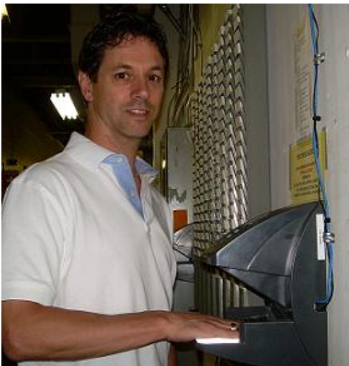
מערכת זיהוי ביומטרית הפועלת Bemis Flexible Packaging ב-2

פתרונות Synerion לניהול מערך העובדים, המפקחים ומרכזים אוטומטית את תהליכי ניהול כוח העבודה במגזר הייצור